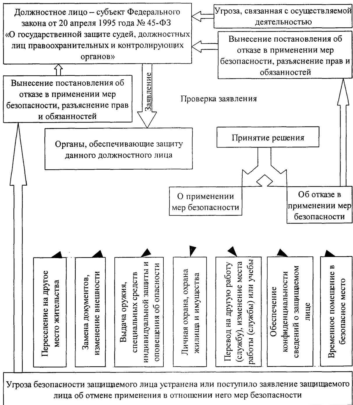
Схема реализации норм Федерального закона от 20 апреля 1995 г. № 45-ФЗ

к Административному регламенту Министерства внутренних дел Российской Федерации по исполнению государственной функции обеспечения в соответствии с законодательством Российской Федерации государственной защиты судей, должностных лиц правоохранительных и контролирующих органов, безопасности участников уголовного судопроизводства и их близких