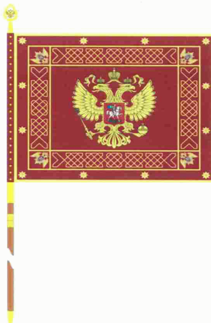
РИСУНОК типового образца знамени территориального органа Федеральной службы войск национальной гвардии Российской Федерации

УТВЕРЖДЕН Указом Президента Российской Федерации от 30 декабря 2019 г. № 637