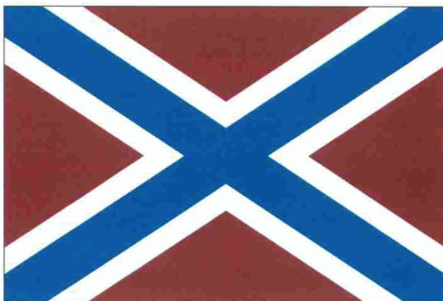
РИСУНОК флага кораблей, катеров и судов войск национальной гвардии Российской Федерации

УТВЕРЖДЕН Указом Президента Российской Федерации от 30 декабря 2019 г. № 637